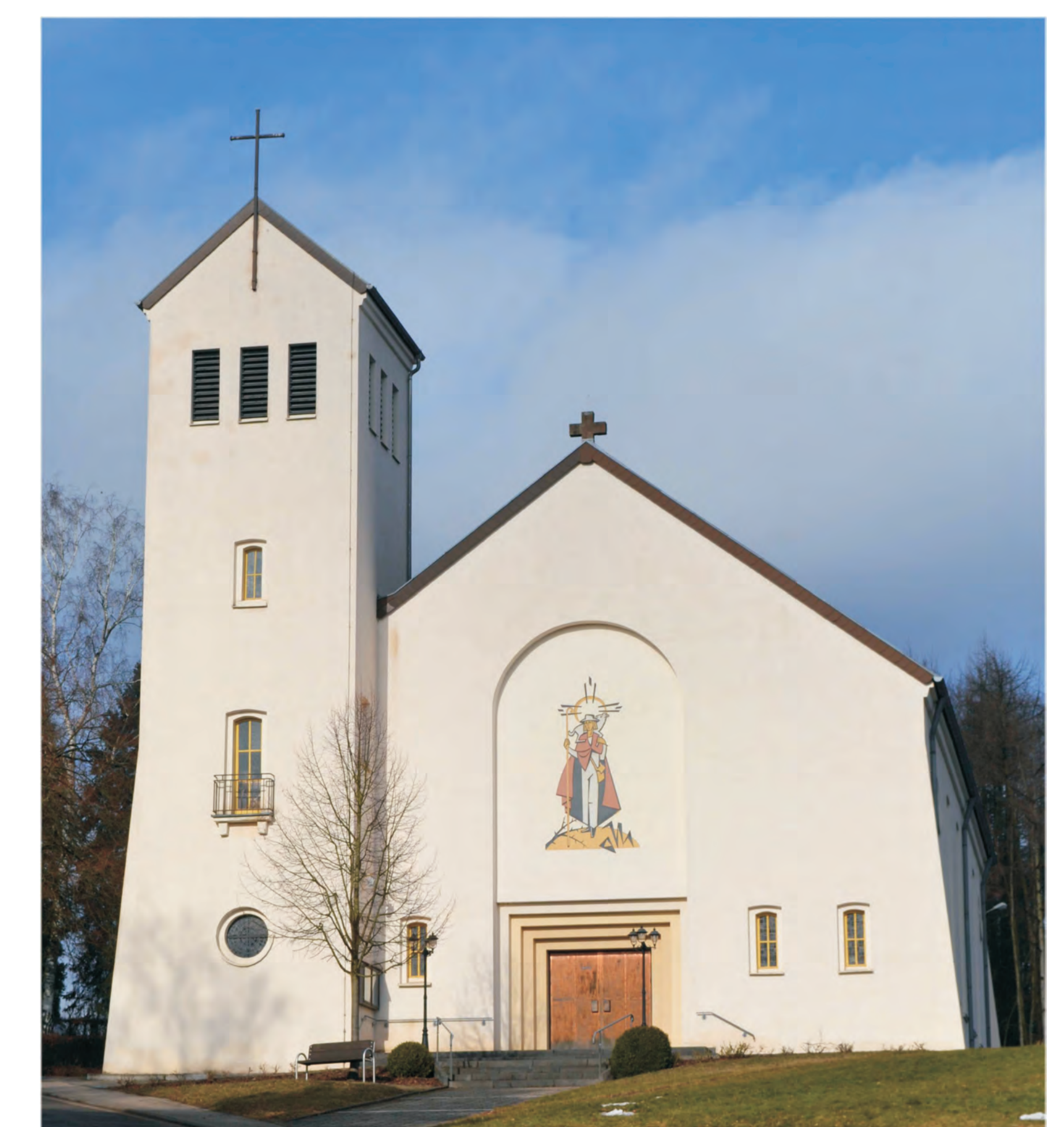
Die Pfarrkirche St. Maternus wurde in den Jahren 1950/51 gebaut.