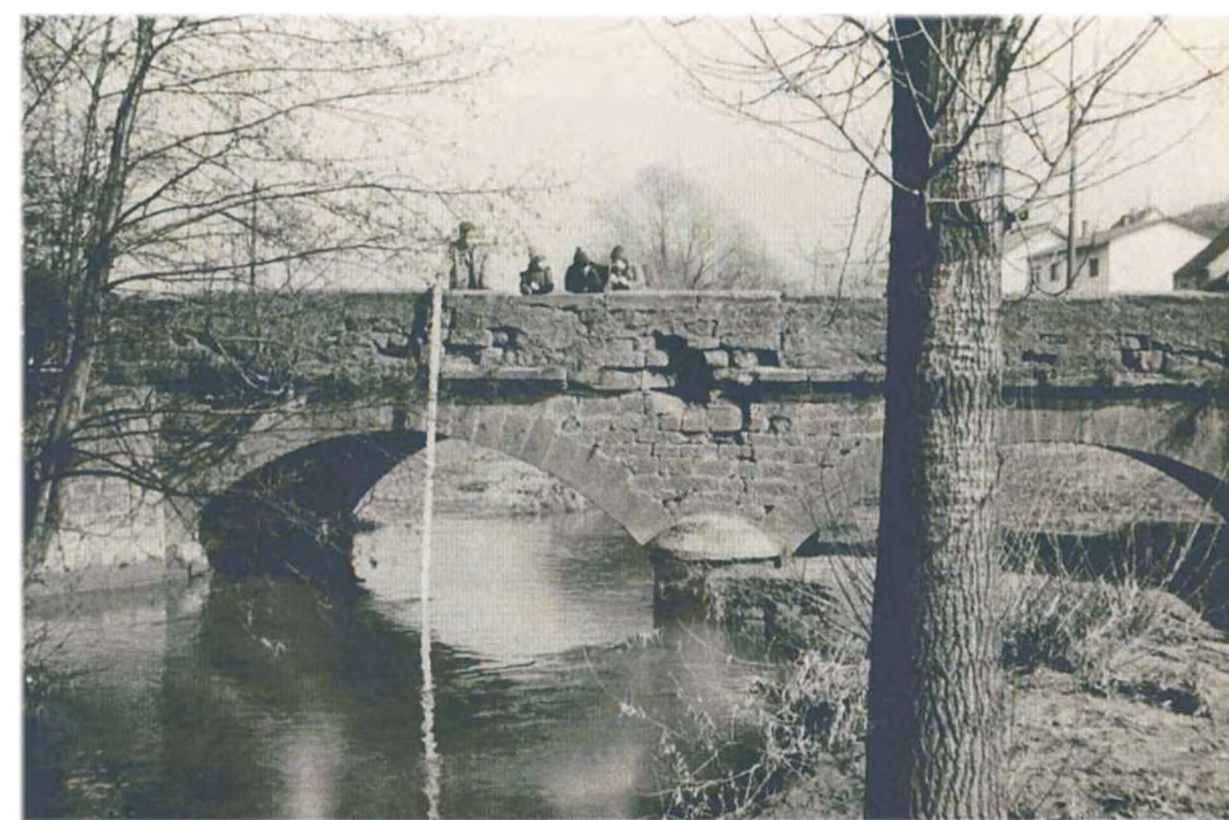
Die alte Holzbrücke über die Theel wurde 1834 von Steinmetz Adam Canyon (*1773) ersetzt. Die aus zwei Bögen bestehende Steinbrücke musste 1969 dem modernen Autoverkehr weichen. Quelle: Aschbacher Heimathefte 1, 2010, 17.