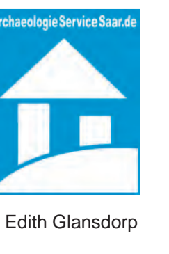
Layout: Glansdorf, Text: Josef Nikolai, L. Wilms, Edin Glansdorf, Büro und Verlag Glansdorf (c) 2017