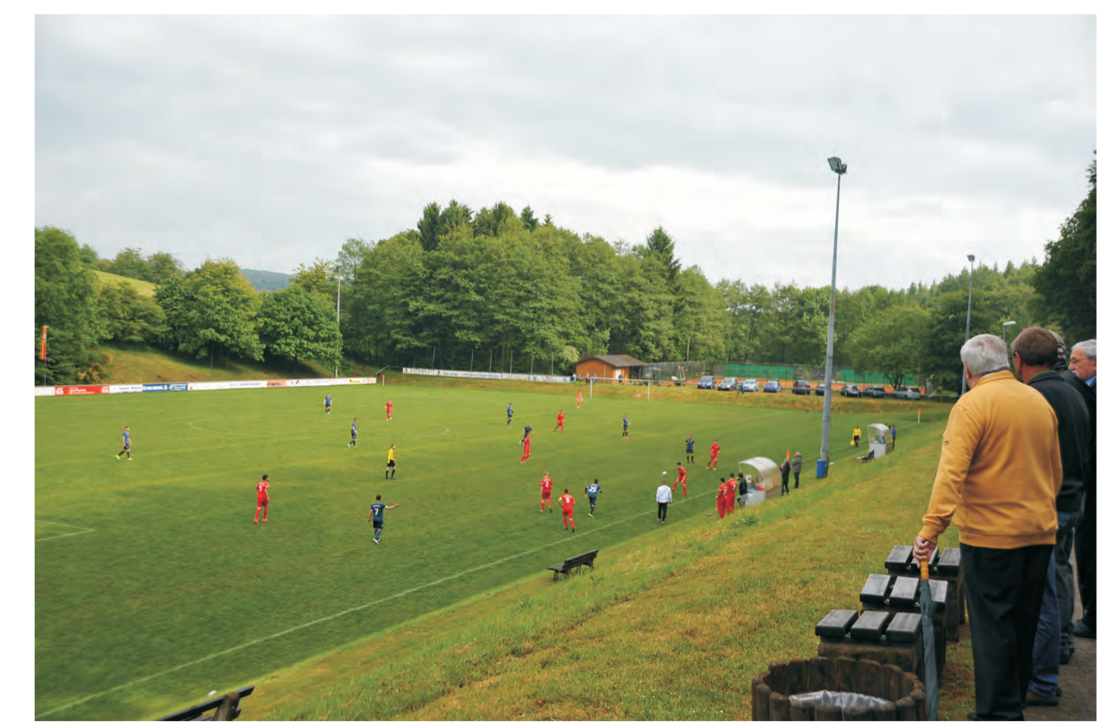
Auf dem Fußballplatz und im Dorf ist immer was los.