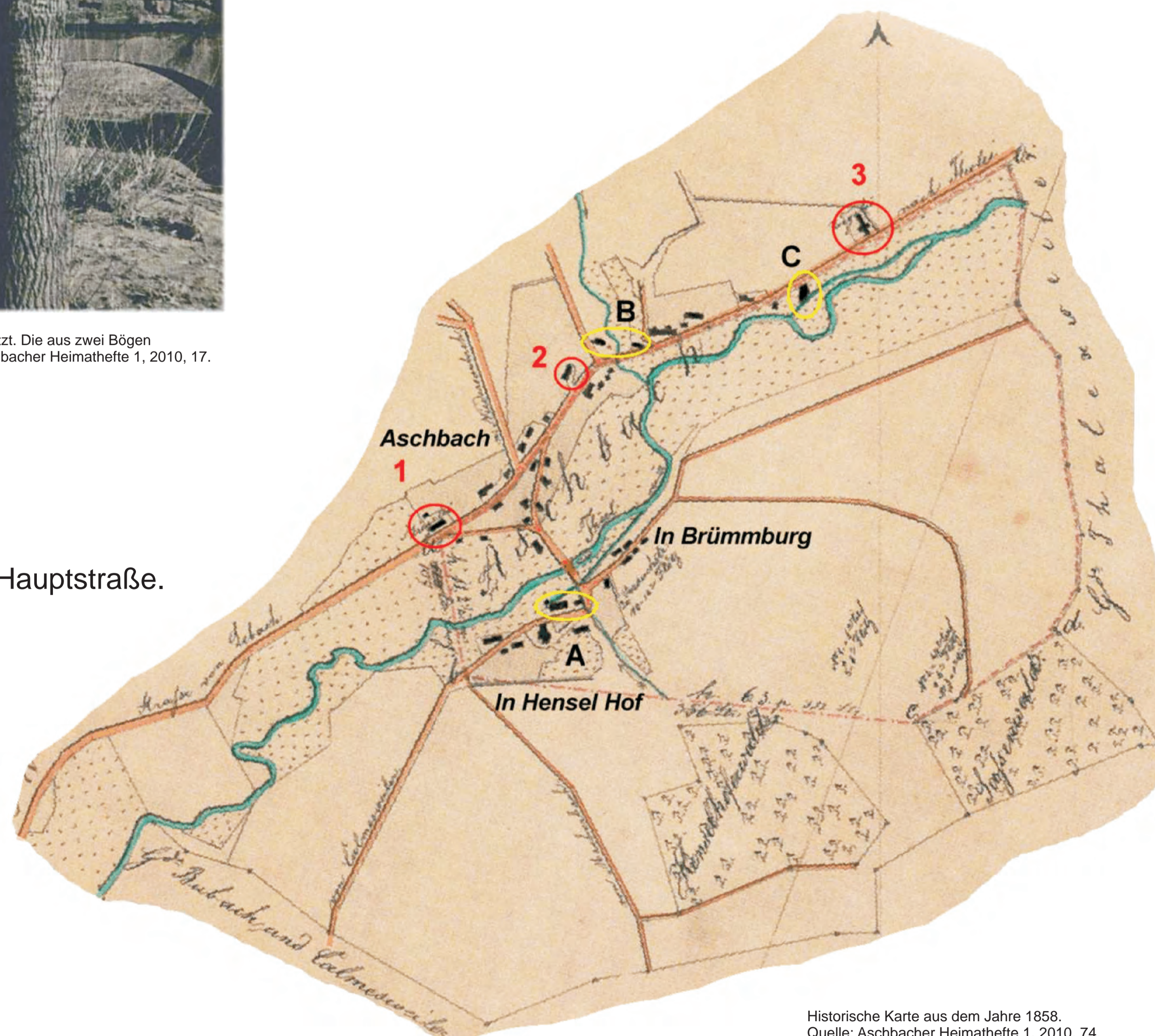
Historische Karte aus dem Jahre 1858.

Mehr zum Ort unter www.unser-aschbach.de