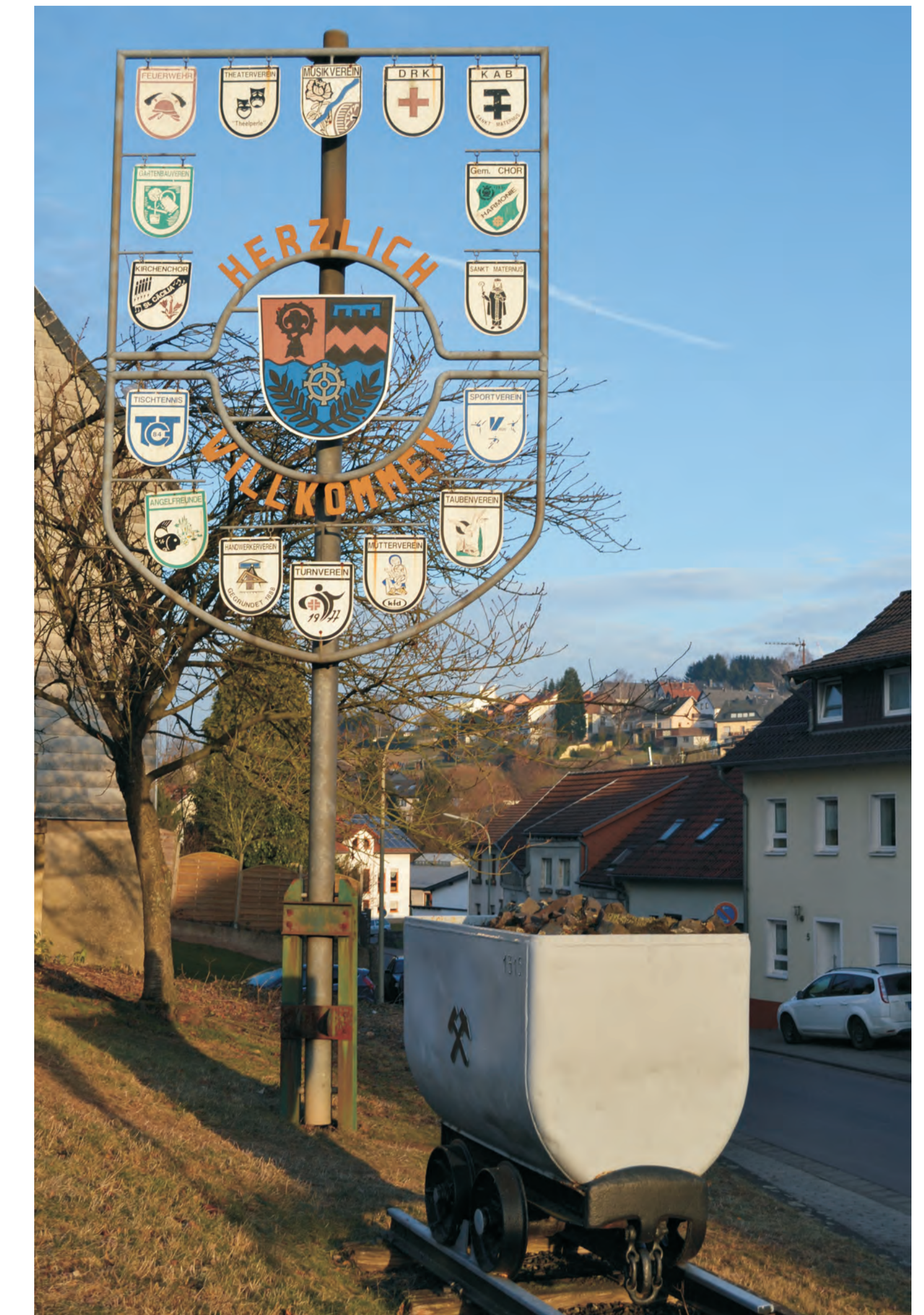
Der Wappenbaum - Symbol der Dorfgemeinschaft und des kulturellen Lebens. Die Lure erinnert daran, dass im letzten Jahrhundert viele Aschbacher in den Steinkohlegruben arbeiteten.

Wandern an alten Grenzen mit Geschichten rund um Wasser, Klima, Wald und bunten Steinen.