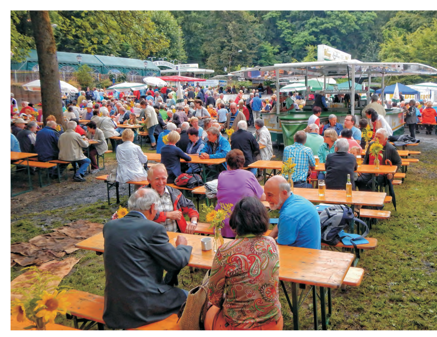
Besucher der Höchstener Kirmes nach der Pilgermesse am 3. August 2016.