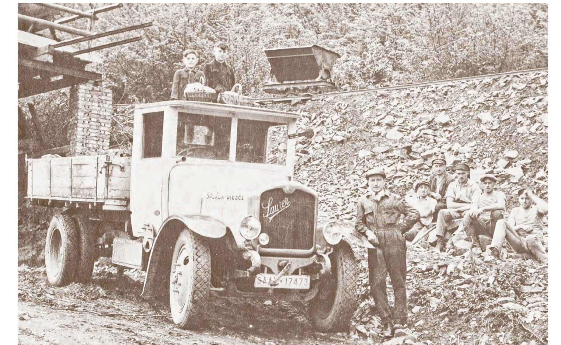
Mittagspause im Steinbruch Höchsten um 1930

An der Südflanke des Klipperberges wurden die kleinen Steinbrüche ab den 1920er Jahren kontinuierlich vergrößert. Das Basaltgestein (Andesit) wurde zu Kopfsteinpflaster und Packlager im Straßenbau verarbeitet. Das Gestein war hierfür hervorragend geeignet und die im Gestein vorkommenden Gang-Achate und Pyrit sind unter Mineraliensammlern bekannt.