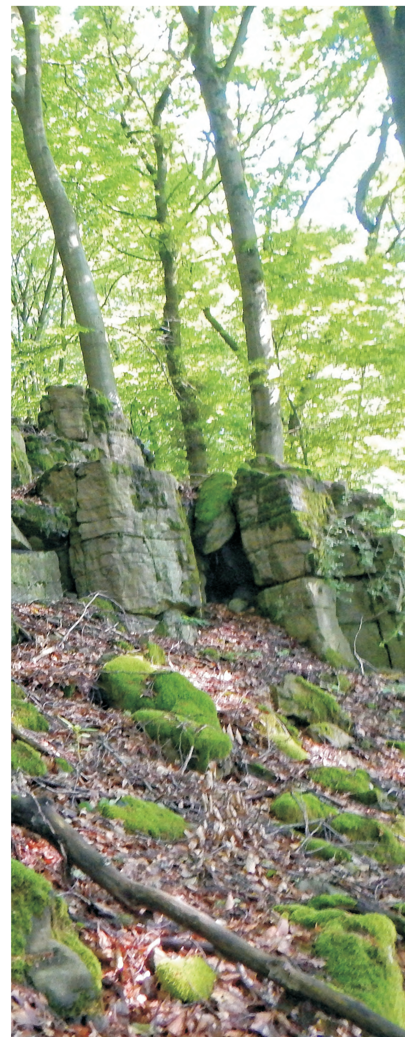
Die Basaltsäulen des Königssteins am Lindenberg.

Teile von Höchsten gehörten bis zum Ende des 18. Jh. mit den Orten Dörsdorf, Steinbach und Aschbach zur Meierei Thalexweiler. Gresaubach zählte zur Meierei Bettingen. Zusammen lagen die Orte im Amt Schaumburg, im Herzogtum Lothringen. Der Greinhof, am Südhang des Steinberges, war Teil der Vierherrschaft Lebach, zu der auch die Orte Rümmelbach und Niedersaubach gehörten. Die Vierherrschaft Lebach zählte zum heiligen römischen Reich Deutscher Nation. Einige Steine dieser alten Territorialgrenze aus dem 18. Jahrhundert sind im Wandergebiet Höchsten erhalten geblieben. Bis 1974 verlief über Höchsten auch die Kreisgrenze zwischen Ottweiler und Saarlouis.